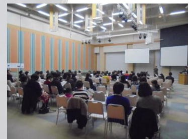
三川町 なの花ホールでの様子です。